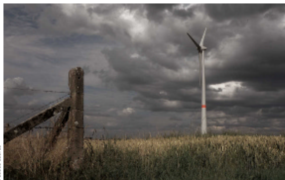
Bientôt, une éolienne citoyenne à Gesves

En parcourant ce Vert de Contact, vous découvrirez que, dès aujourd'hui, vous pouvez participer activement à une démarche coopérative dans le domaine énergétique.